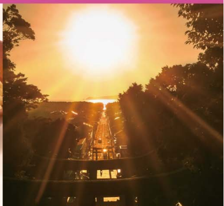
宮地嶽神社からの光の道（福津市）