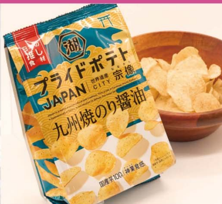
宗像市×湖池屋「プライドポテトJAPAN 宗像九州焼のり醤油」