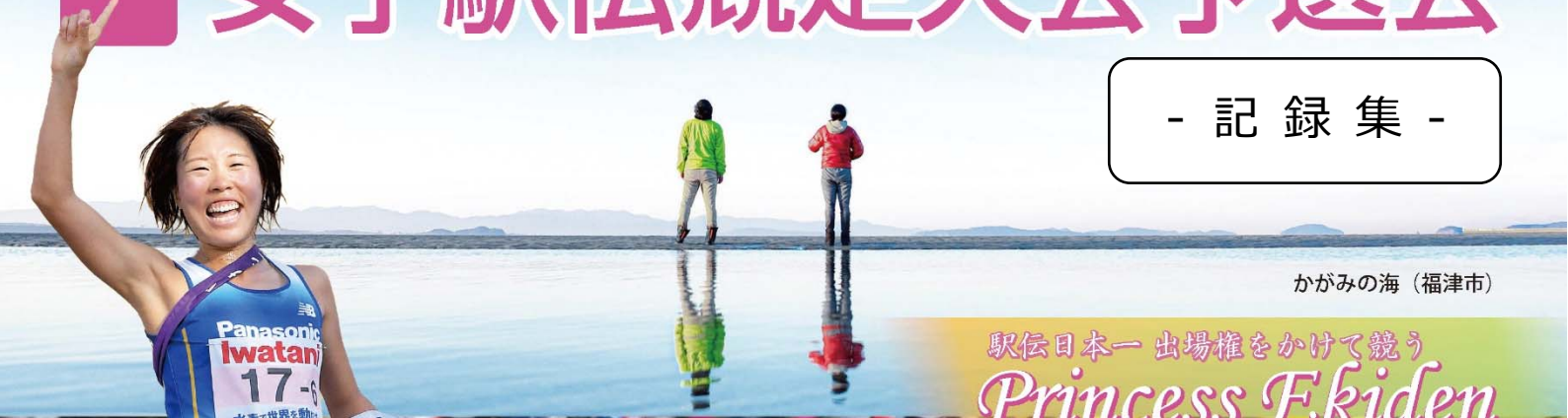
かがみの海（福津市）